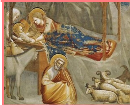
Nativité de Giotto, chapelle Scrovegni de Padoue

À l'approche de Noël, musiciens professionnels et amateurs éclairés se réunissent autour de noëls populaires issus d'une longue tradition venue du moyen-âge.