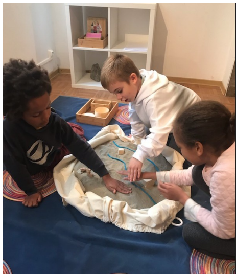
La grande famille, l'histoire d'Abraham à l'école biblique