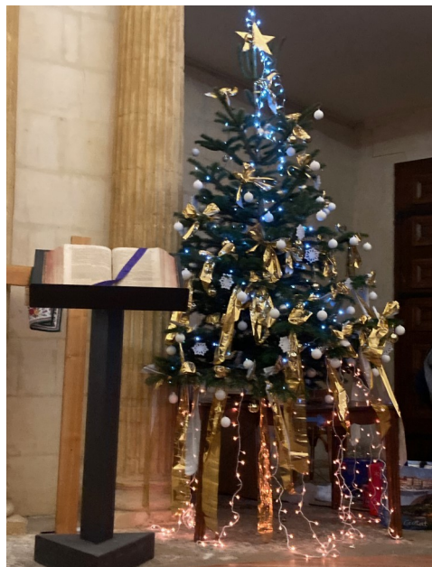
Décoré par Anne-Marie HAEFELE