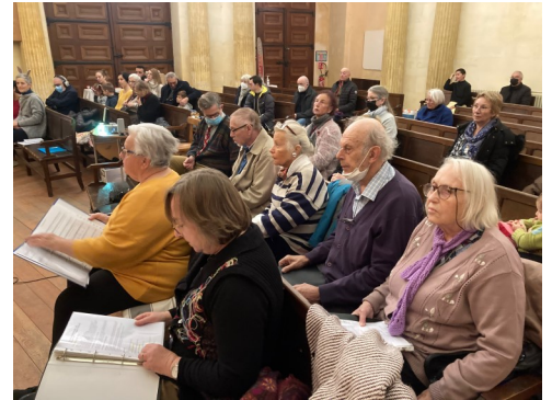
Culte de Noël des enfants le 18/12