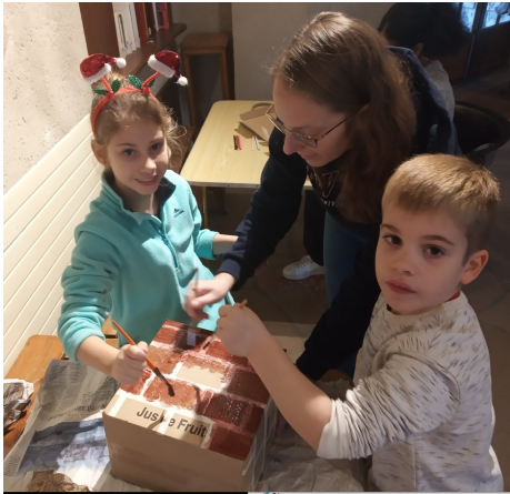
La préparation des fêtes de Noël à Pomeyrol