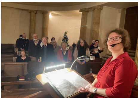
La veillée de Noël

Les grandes personnes n'étaient pas en reste non plus.