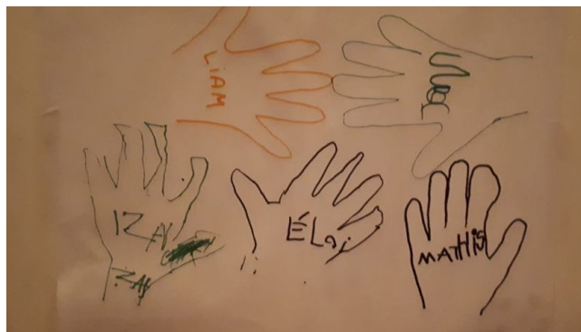
Le groupe des enfants de l'éveil biblique