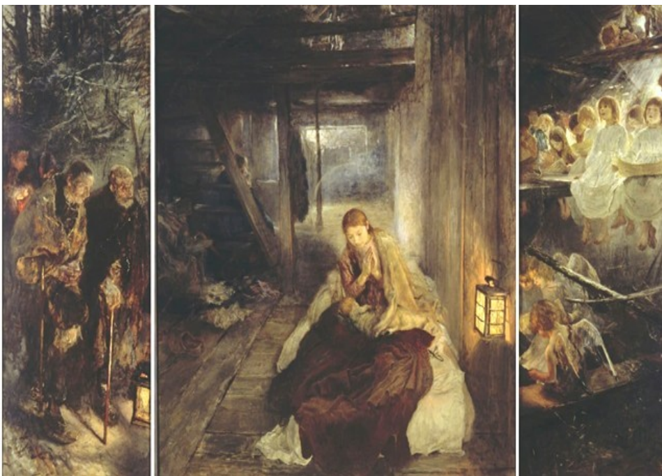
Fritz von Uhde (1848-1911), La sainte Nuit [Die Heilige Nacht] ,